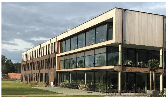
Woonzorgcentrum Keiheuvel – Balen (BE)

De sites hebben samen een totale bovengrondse oppervlakte van meer dan 38.000 m 2 en een capaciteit van 562 eenheden. Ze zijn verspreid over Vlaanderen.