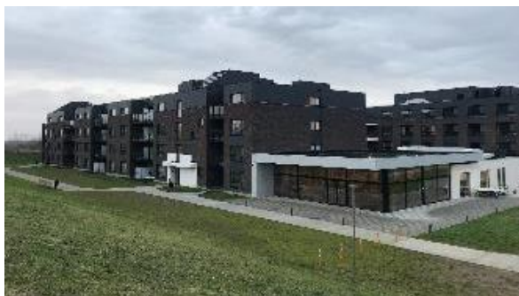
Woonzorgcentrum Puthof – Borgloon (BE)