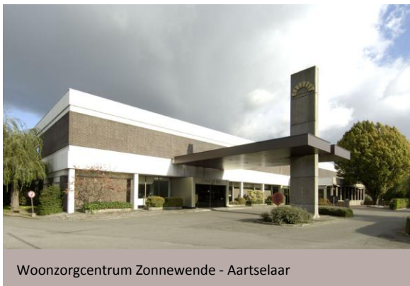
Woonzorgcentrum Zonnewende - Aartselaar

Op 24.06.2016 hebben Cofinimmo en Senior Living Group (Groep Korian-Medica) eveneens een samenwerkingsakkoord ondertekend voor de renovatie en de uitbreiding van twee woonzorgcentra in België. Het totale bedrag van de werken beloopt 9,2 miljoen EUR.