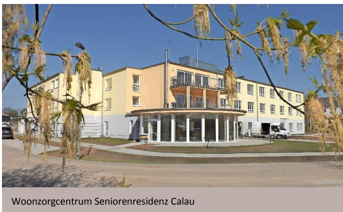
Woonzorgcentrum Seniorenresidenz Calau

Op 22.07.2016 heeft de Cofinimmo Groep Seniorenresidenz Calau in Duitsland verworven 1 . Het betreft een woonzorgcentrum in Calau, in de regio van Brandenburg. Deze nieuwbouw, goed voor 4 600 m 2 , telt 81 bedden en 20 plaatsen voor dagverzorging.