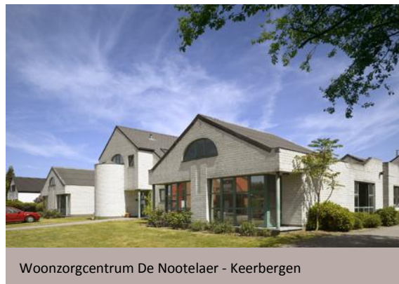
Woonzorgcentrum De Nootelaer - Keerbergen

Na renovatie en bouw van een uitbreiding van 3 500 m 2 zal het woonzorgcentrum Zonnewende te Aartselaar in totaal 200 bedden tellen. De werken zullen in het tweede halfjaar van 2016 starten en beëindigd zijn in het tweede kwartaal van 2018.